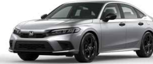
Lunar Silver Metallic