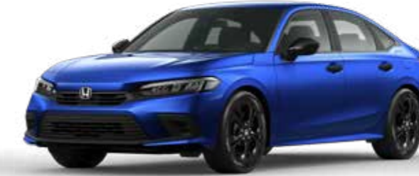
Brilliant Sporty Blue Metallic