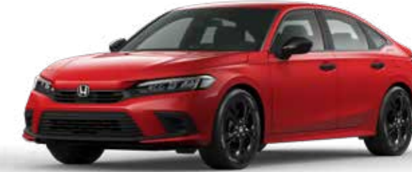
Coffee Cherry Red Metallic