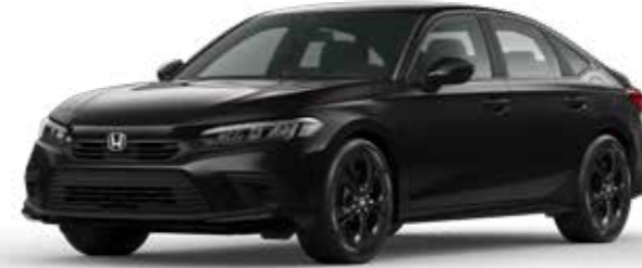
Crystal Black Pearl