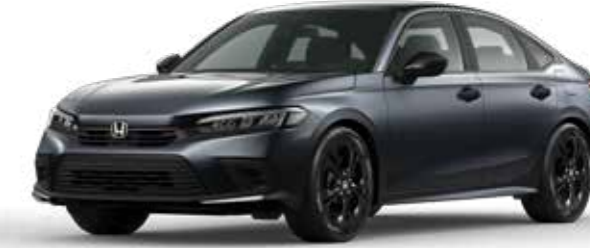
Meteoroid Gray Metallic