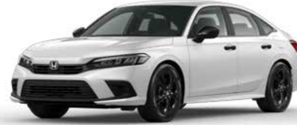
Platinum White Pearl