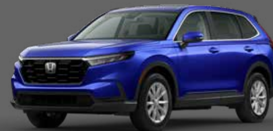
Brilliant Sporty Blue أزرق Brilliant Sporty