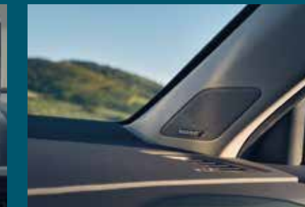
PREMIUM SOUND SYSTEM WITH BOSE SPEAKERS