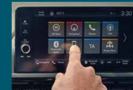
9" HONDA DISPLAY AUDIO INFOTAINMENT SYSTEM

The 9" Display Audio seamlessly links you to your favourite apps via Apple CarPlay® and Android Auto™. It also features a navigation system that incorporates a smart fuel-saving option.