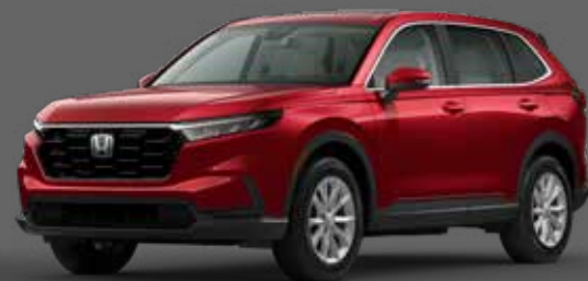
Coffee Cherry Red أحمر Coffee Cherry