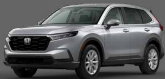
Lunar Silver Metallic فضي Silver معدني