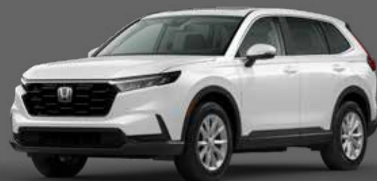
Platinum White Pearl أبيض Platinum لؤلؤي