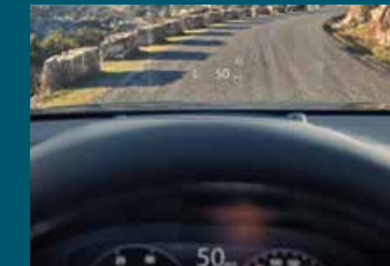
HEAD UP DISPLAY

The Head Up Display helps you stay focused on the road, providing an even greater sense of security. And with features such as deceleration paddles on the multi-function steering wheel and our Hill Descent Control, which delivers secure automated deceleration on steep downhills, you'll always feel in control.