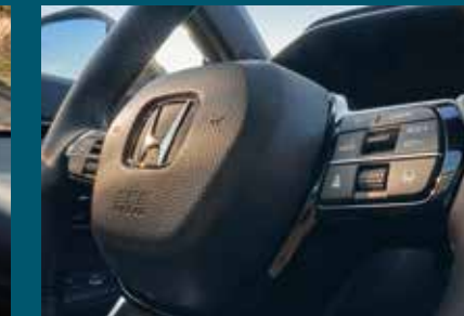
HILL DESCENT CONTROL