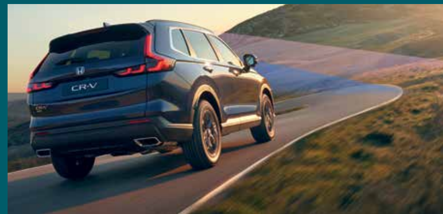
Model shown is the Honda CR-V Touring grade 1.5T VTEC in Canyon River Blue Metallic

It's all because we want you and your passengers to enjoy the journey in comfort, safe in the knowledge you're prepared for whatever comes your way.