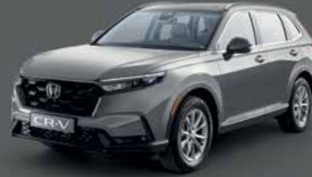
Lunar Silver Metallic فضي لونا ميتاليك