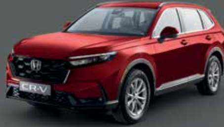
Coffee Cherry Red Metallic أحمر كوفي شيري