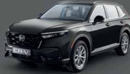
Crystal Black Pearl أسود كريستال لؤلؤي