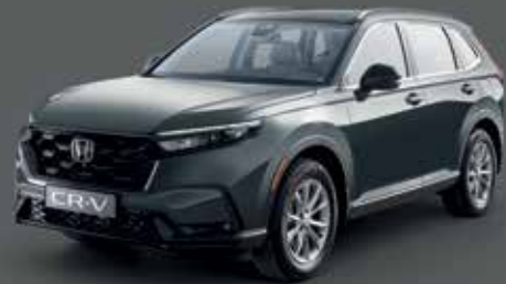
Meterpid Gray Metallic رمادي ميتاليك