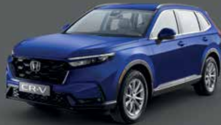
Brilliant Sporty Blue أزرق بريليانت رياضي