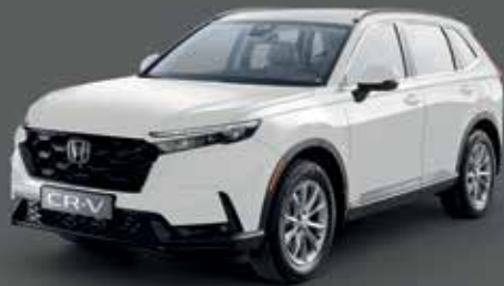
Platinum White Pearl أبيض بلاتينوم لؤلؤي