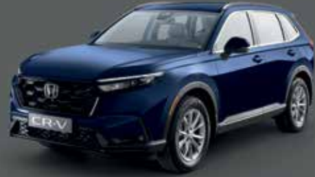
Canyon River Blue Metallic أزرق كانيون ريفر ميتاليك