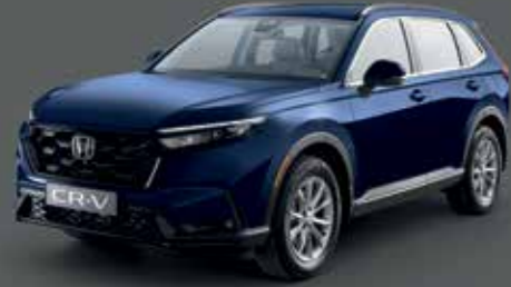
Canyon River Blue Metallic أزرق كانيون ريفر ميتاليك