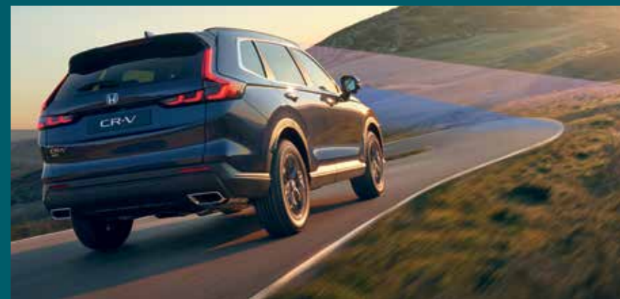
Model shown is the Honda CR-V Touring grade 1.5T VTEC in Canyon River Blue Metallic

It's all because we want you and your passengers to enjoy the journey in comfort, safe in the knowledge you're prepared for whatever comes your way.