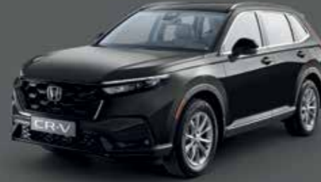
Crystal Black Pearl أسود كريستال لؤلؤي