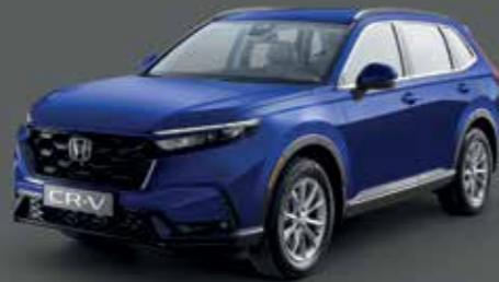
Brilliant Sporty Blue أزرق بريليانت رياضي