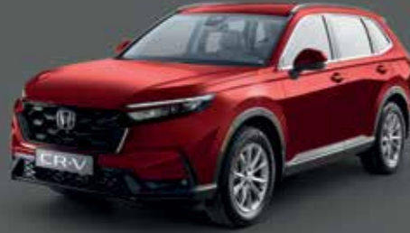
Coffee Cherry Red Metallic أحمر كوفي شيري