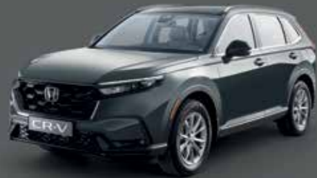
Meterpid Gray Metallic رمادي ميتاليك