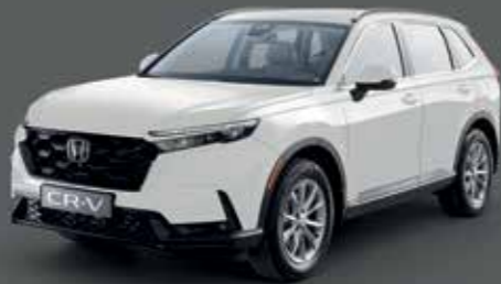
Platinum White Pearl أبيض بلاتينوم لؤلؤي