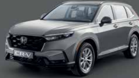
Lunar Silver Metallic فضي لونا ميتاليك