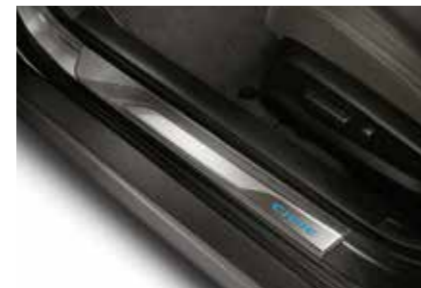
غطاء جانبي مضاء Illuminated Side Sill