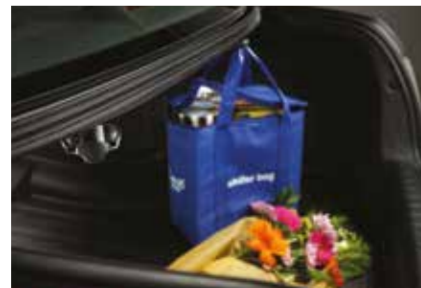
حبال Cargo Hooks