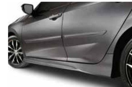
حزمة للأبواب الجانبية Body Side Molding

Specifications vary according to country. Please consult your local dealer for details.