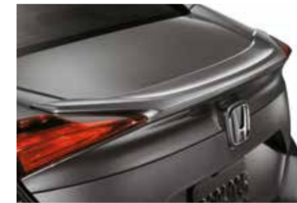
جناح خلفي نوع دكلد Deck Lid Spoiler