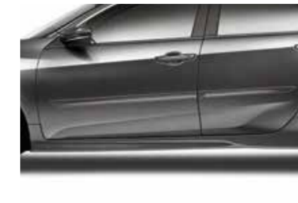
مصد جانبي سفلي Side Under Spoiler