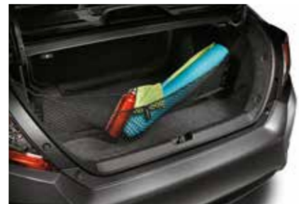
شبكة Cargo Net