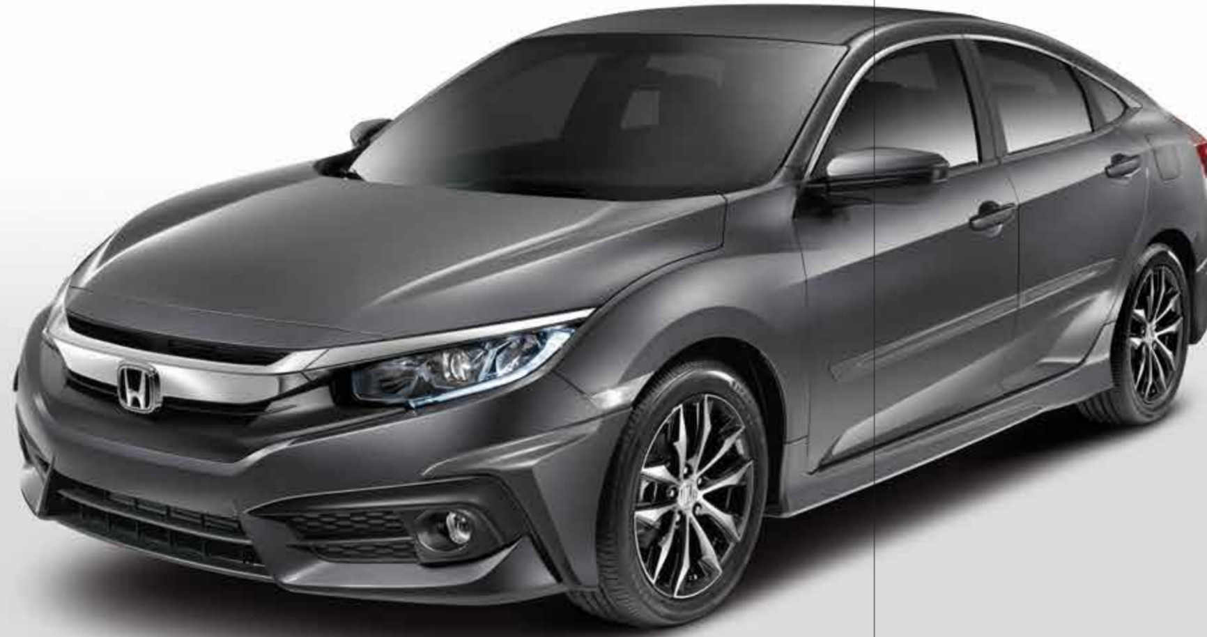
مصد أمامي سفلي Front Under Spoiler