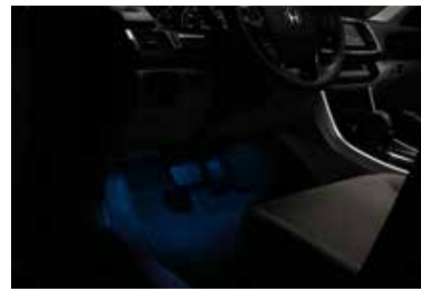
إضاءة الأجواء الداخلية Ambient Light