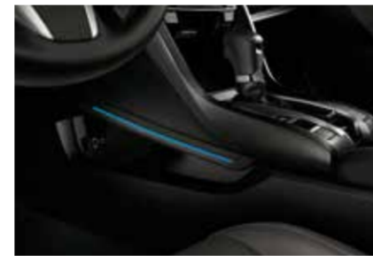
وحدة تحكم مركزية مضاءة Illuminated Central Console