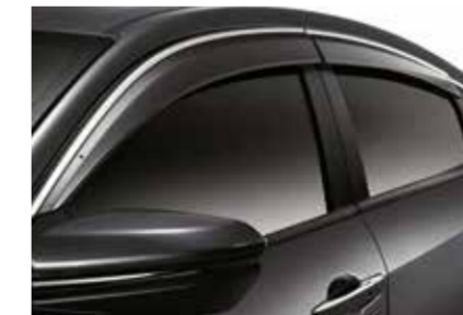
حاجب للباب Door Visor