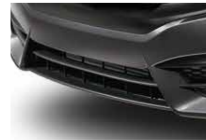
مصد أمامي سفلي Front Under Spoiler