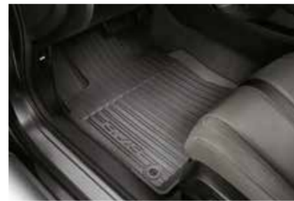
دعاسة لكل الفصول All Season Floor Mat