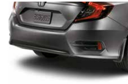
مصد خلفي سفلي Rear Under Spoiler