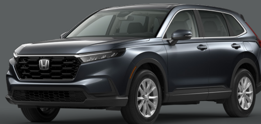
Gris Météoroïde Métallisé