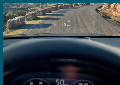
DÉCÉLÉRATION AUTOMATISÉE EN PENTE

L'affichage tête haute vous aide à rester concentré sur la route pour vous procurer un sentiment de sécurité. Vous pouvez toujours garder le contrôle de votre conduite grâce à des fonctionnalités telles que les palettes de décélération sur le volant multifonction et notre système de contrôle en descente, qui assure une décélération automatisée en toute sécurité dans les descentes abruptes.