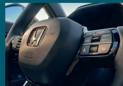
ACCÉLÉRATION FLUIDE ET RÉACTIVE