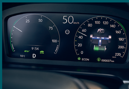
ÉCRAN NUMÉRIQUE DE 10,2"

Nous avons intégré au niveau du nouveau CR-V toute une série de technologies utiles et informatives, notamment des écrans haute résolution et une connectivité optimale.