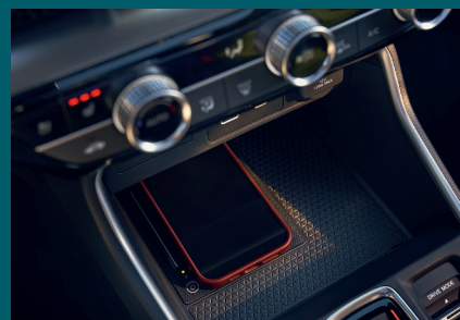
CHARGEUR SANS FIL POUR SMARTPHONE