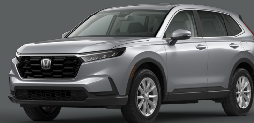
Argent Lunaire Métallisé