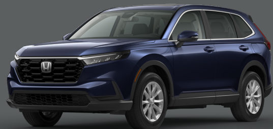
Bleu Canyon Métallisé