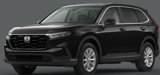
Cristal Noir Perle