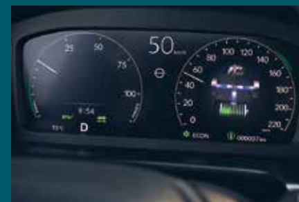
ÉCRAN NUMÉRIQUE DE 10,2"

Nous avons intégré au niveau du nouveau CR-V toute une série de technologies utiles et informatives, notamment des écrans haute résolution et une connectivité optimale.