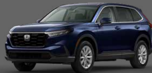
Bleu Canyon Métallisé