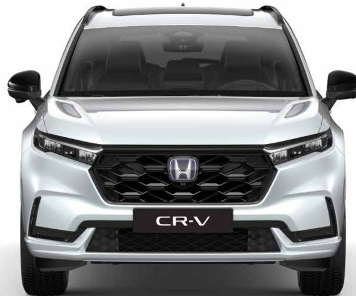
Le modèle présenté est le Honda CR-V e:HEV en Blanc Platine.