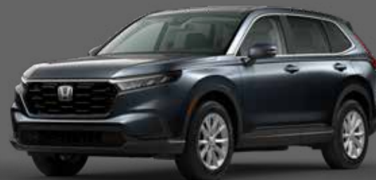
Gris Météoroïde Métallisé