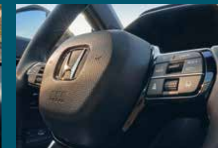
DÉCÉLÉRATION AUTOMATISÉE EN PENTE