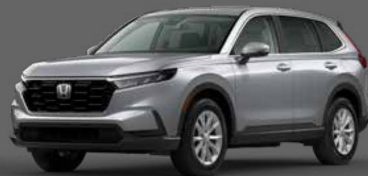
Argent Lunaire Métallisé