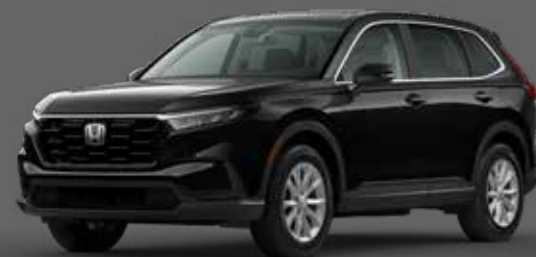
Cristal Noir Perle