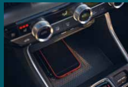
CHARGEUR SANS FIL POUR SMARTPHONE